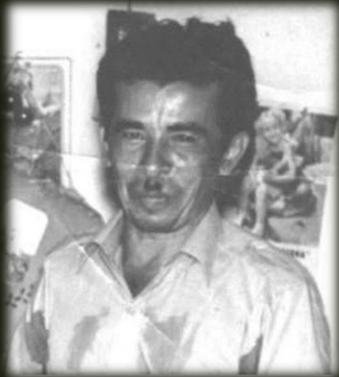
*Sr. Rosendo Radilla Pacheco

“Caso Radilla Pacheco vs México y control de convencionalidad”